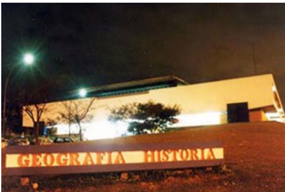
Prédio de Geografia e História